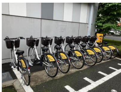
▲シェアサイクルステーション(イメージ) 東急バス荏原営業所ステーション