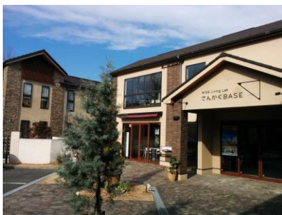
▲ WISE Living Lab 外観